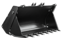
КОВШ 4 В 1